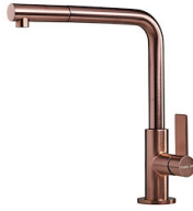
VELA PLUS COPPER satiné 8498 128