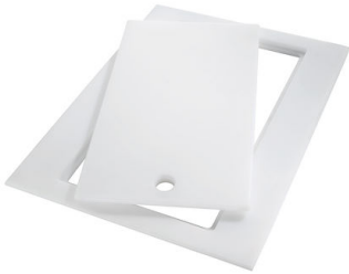
Planche de découpe Twin in HDPE 8644 101