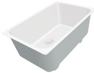
Cuvette blanche 8153 100